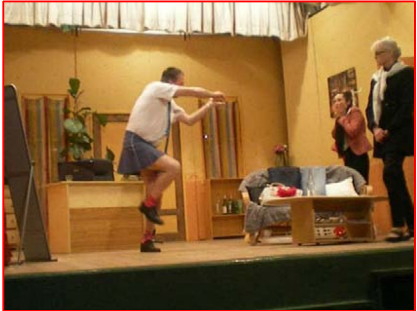
La troupe en action lors de la représentation de juin 2015.

Si vous avez un peu de temps libre et vous souhaitez nous soutenir, nous recherchons des moyens matériels et physiques.