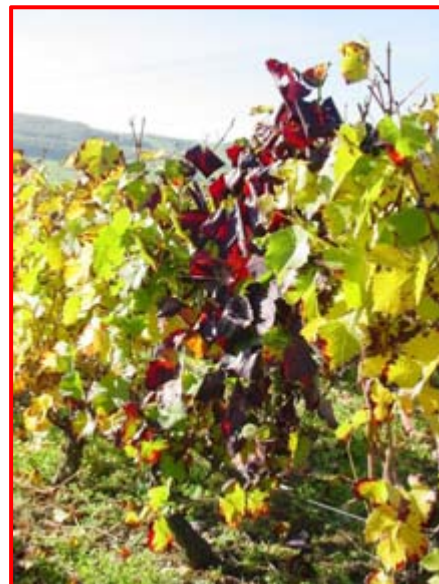
Concernant la flavescente dorée, la prospection sur l'ensemble du vignoble de la commune a été effectuée.