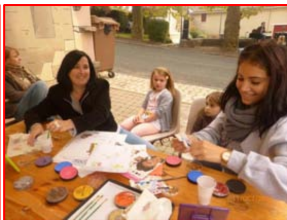
Fête du Vin nouveau, dimanche 11/10/2015.

Pour 2015-2016, nous avons réalisé ou prévoyons d'organiser :