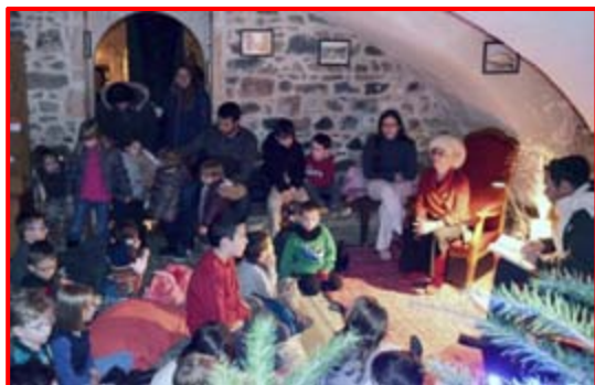
Soirée contes au caveau lors de la fête de l'hiver.