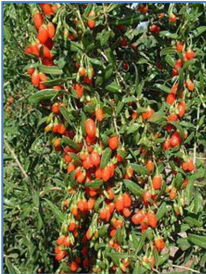
Lycium barbarum ou lyciet.

Pour éviter l'arrachage et la multiplication des friches sur la commune avec la baisse des revenus pour les viticulteurs en Beaujolais et Beaujolais-Villages, le syndicat viticole et la mairie ont engagé une réflexion concernant la diversification. Après la mise en relation des propriétaires de parcelles arrachées avec des agriculteurs des communes voisines pour faire pâturer des bovins, les plantations en Chardonnay, Viognier et Pinot Noir pour étendre la gamme des vins proposés en bouteille, quelles alternatives les exploitants ont-ils ?