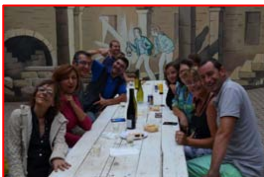
Belle ambiance pour la Julliabroc, malgré la pluie.