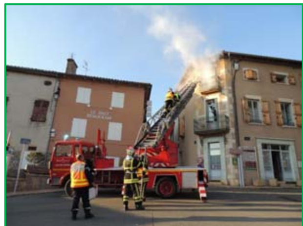
Manœuvre des pompiers – évacuation des gîtes communaux.

Le capitaine Alain Chambard et l'adjudant Sébastien Piquand