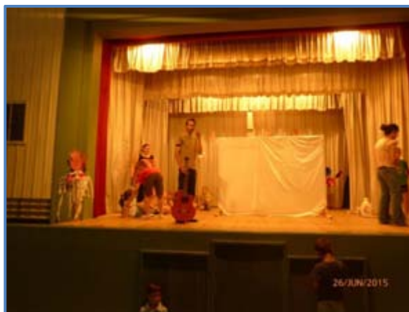
Préparation du spectacle de fin de module en présence de Nicolas TURPAULT et Marie GRANGE.