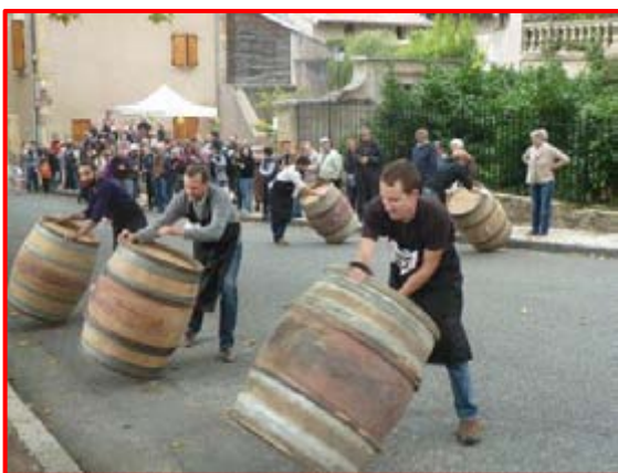
Course de rouleurs de tonneaux, dimanche 11/10/2015.

Merci à nouveau à tous les Julliatons et Julliatonnes présents !!!