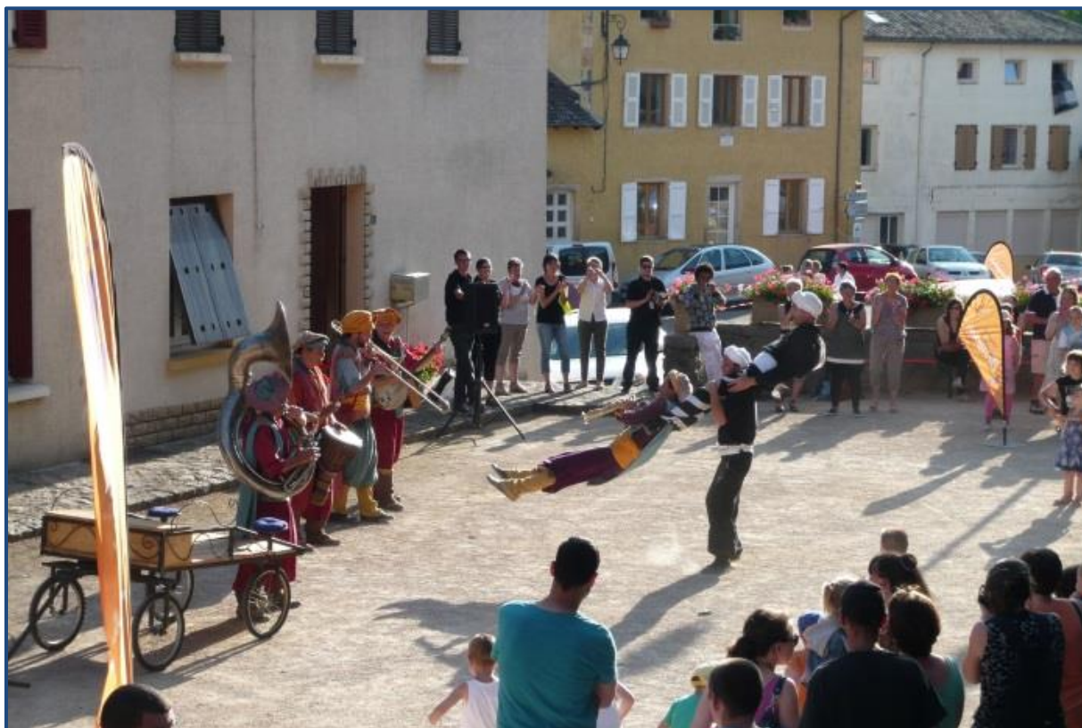
La Tit' Fanfare en action sur la place du monument aux morts.

Le 27 juin 2015, en partenariat avec le CCAB (Centre Culturel Associatif Beaujolais), nous avons pu vous présenter un spectacle de rue « La Tit' Fanfare » qui a pu ravir petits et grands.