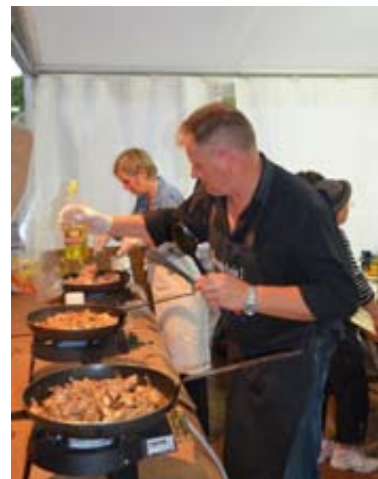
L'équipe du caveau est mobilisée pour les bréchets !