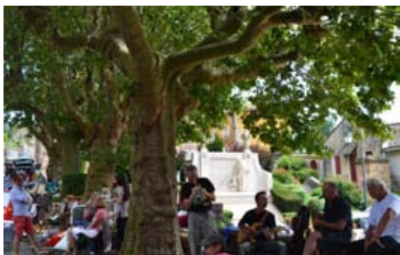
Concert improvisé lors de la « Julliabroc »

La randonnée « la Julliatonne » s'est déroulée le dimanche 13 avril. Elle a réuni plus de 200 marcheurs répartis sur les 3 parcours de 8, 14 et 21 kilomètres qui ont pu découvrir les beaux paysages du nord-Beaujolais, du côté des cols de Gerbet et de la Sibérie, et du Gros Houx où avait été installé le ravitaillement des circuits de 14 et 21 kilomètres. Les marcheurs ont apprécié notamment la variété des parcours, entre forêts, prairies et vignoble. À l'arrivée une centaine de marcheurs ont apprécié l'assiette du randonneur préparée par les membres de l'association. La