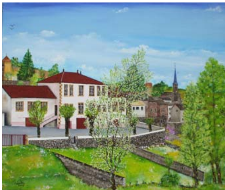
Tableau réalisé par Paul Dailier, 2009