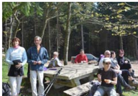
La Julliatonne : ravitaillement au Gros Houx.

L'association « Jullié Animations », émanation du syndicat d'initiative, a été créée en février 2000. Elle a pour vocation d'animer le village et de développer sa notoriété dans la région. Elle organise à cet effet diverses manifestations annuelles, et ce dans différents domaines : loisirs, culture, sport... Trois manifestations majeures ont été développées au fil des ans et ont acquis une certaine notoriété : la randonnée « la Julliatonne », la brocante vide-greniers « la Julliabroc » et, la plus récente, « la Fête de l'hiver » qui fut un temps la fête des marrons.