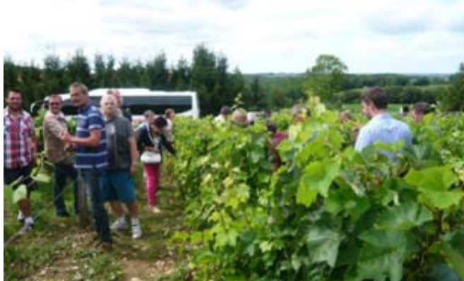
Nos vigneronn en visite ...

Depuis maintenant deux ans, le syndicat a décidé d'organiser un voyage technique. Après avoir visité le vignoble des Côtes Roannaises en 2013, nous nous sommes rendus en Août dernier à Charcenne en Haute Saône pour une visite des pépinières Guillaume. La journée placée en premier lieu sous le signe de la convivialité nous a permis d'acquérir de nombreuses connaissances autour du greffage de la vigne. Pour 2015, nous envisageons la visite du vignoble suisse ou de la vallée du Rhône.