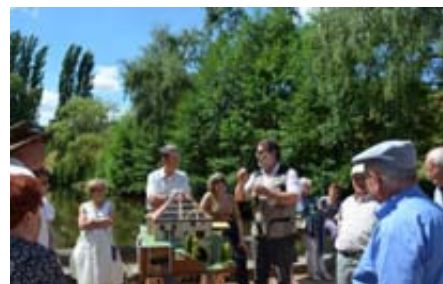
Présentation de la maquette lors des journées des Moulins