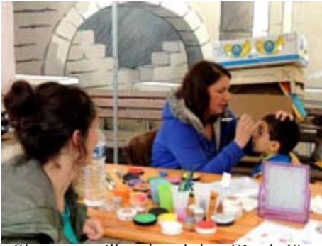
Séance maquillage lors de la « Fête du Vin Nouveau »

Notre Assemblée Générale a eu lieu le 27 juin 2014 en la présence de 18 familles, 2 représentants de la municipalité. Notre prochaine Assemblée Générale se tiendra le jeudi 25 juin 2015.