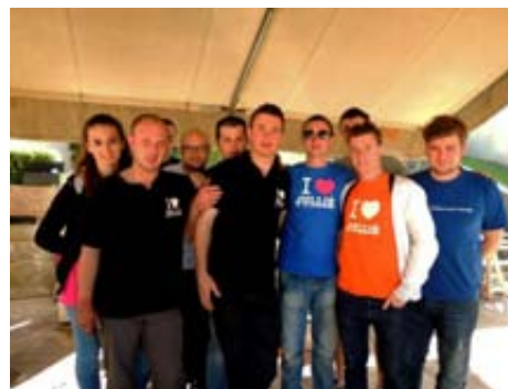
Les Cadets posent devant l'objectif.

Le 6 avril 2014, nous avons eu la joie de vous accueillir nombreux sur la place du village pour partager nos saucissons. Nous espérons vous y retrouver toujours aussi nombreux en 2015 !