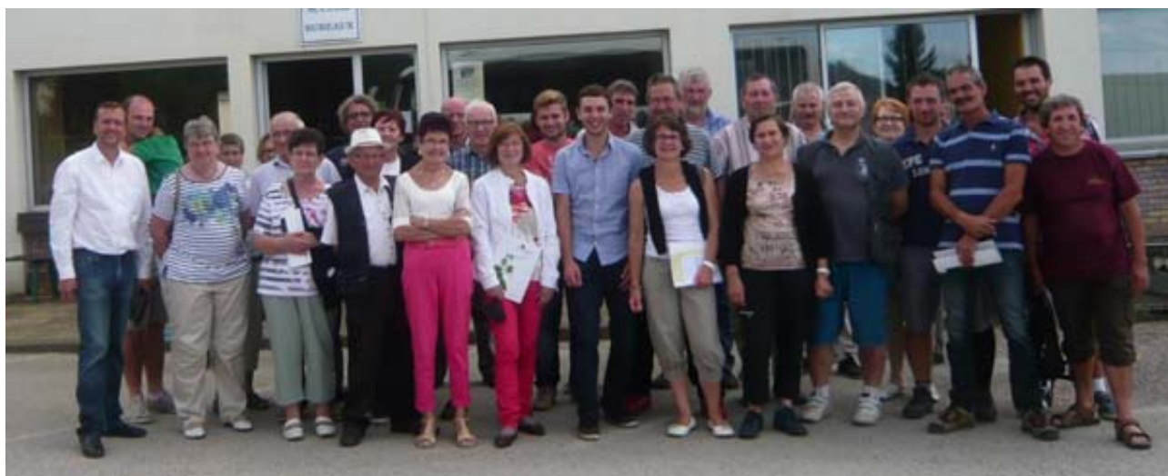
Les membres du syndicat viticole lors de la visite à Charcenne (43).

Après un hiver particulièrement doux et un printemps sec et ensoleillé, la vigne avait démarré en trombe. Cependant, l'été fut fort maussade jusqu'aux environs du 15 Août laissant craindre une moins bonne qualité comme souvent les millésimes en 4. Puis, le mois précédant la récolte, le beau temps s'est installé permettant une récolte qui s'est réalisée dans les 15 derniers jours de Septembre dans d'excellentes conditions. Nous avons encore pu vérifier cette année que le mois qui précède la récolte fait la qualité. Le moral des vigneronn était bon avant d'entamer la campagne des ventes du Beaujolais Nouveau, nous pouvions enfin compter sur une récolte de qualité et surtout de quantité raisonnable ce qui n'était pas arrivé depuis quelques années. Après une entame plutôt bonne, le marché s'est une nouvelle fois orienté à la baisse en fin de campagne avec des volumes de vin vendus en net recul par rapport à l'an dernier. Si nous ajoutons à cela un délire administratif et une très probable interdiction de nombreux désherbants qui viennent encore compliquer notre tâche, nous pouvons craindre une nouvelle vague d'arrachage ou d'abandons de vignes dans les années à venir.