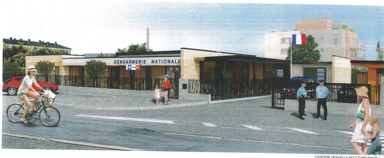
CASERNE DEPUIS LE BOULEVARD ROSSELLI