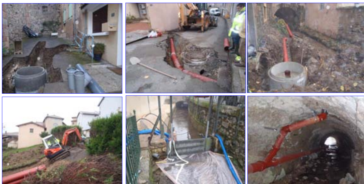
Les différentes phases des travaux d'assainissement

Enfin, concernant l'assainissement, les travaux de rénovation des canalisations du Merdençon sont terminés. Le conseil va étudier l'implantation d'une nouvelle station d'épuration par lagunages répondant aux normes exigées par l'Agence de l'Eau.