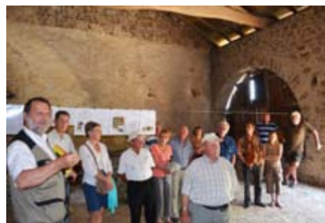
Visite du four à tuiles lors des journées du patrimoine

En attendant que le site soit totalement opérationnel, l'association « les Amis du site de la Roche », affiliée à « la Fédération Française des Amis des Moulins », continue de participer d'une part aux Journées du Patrimoine de Pays et des Moulins (14 et 15 juin), et d'autre part aux Journées du Patrimoine (20 et 21 septembre). Les membres de l'association ont présenté le projet de restauration, au moyen de divers supports, tableaux, planches, rappelant l'histoire du moulin et du four à tuiles, montrant l'avancement des travaux, l'histoire du château. Ces présentations ont connu un beau