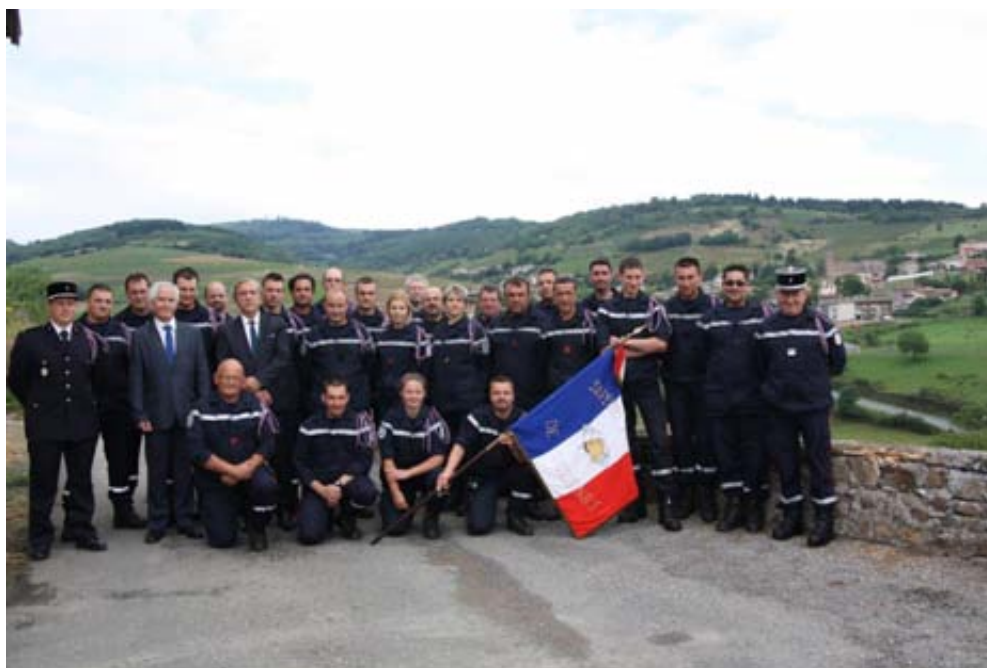
Les Sapeurs Pompiers posant fièrement devant le village

L'ensemble des pompiers se joint à nous pour vous souhaiter nos meilleurs vœux pour cette année 2015.