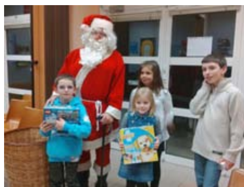
Le Père Noël bien présent à l'arbre de Noël !