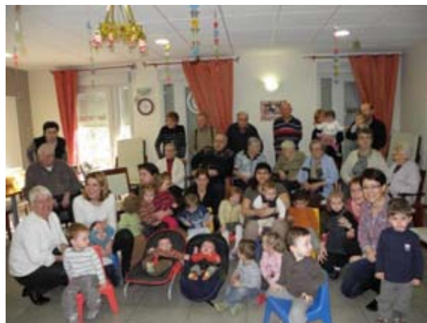
Accueil des tout-petits de l'association Bamin'ou