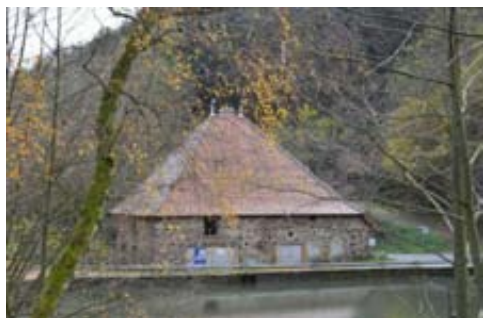
Le moulin, cet automne

La Communauté de Communes de la Région de Beaujeu, suite à la demande de la municipalité de Jullié, a décidé de restaurer le site de la Roche, et notamment le vieux moulin scierie, afin de valoriser le patrimoine local et de promouvoir les savoir-faire traditionnels, le tout dans une optique touristique.