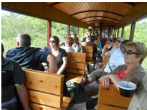
Balade en train le 14 juin 2014