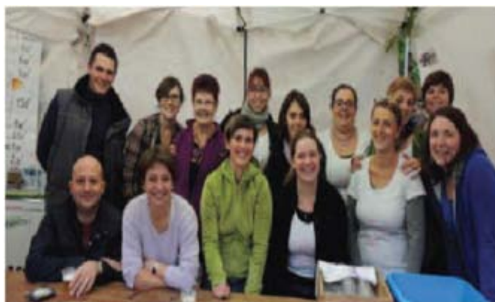
■ Les bénévoles du Sou des écoles.