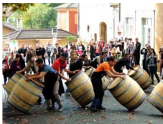
La traditionnelle course de tonneaux de la « Fête du Vin Nouveau »

Nous tenons à remercier les Cadets de Jullié qui, pour la deuxième année, ont animé la journée du samedi 11 octobre et contribué à faire de cette fête un week-end festif sur notre commune. Merci à nouveau à tous les Julliatons et Julliatonnes présents malgré la pluie !!!